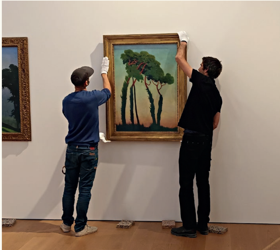
Accrochage du Vallotton en Suisse