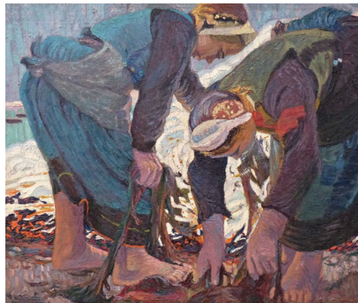
1. Robert Delaunay (1885-1941). Brûleuses de goémon, 1 re moitié du XX e siècle. Huile sur toile, 80 x 100 cm. Dépôt d'une collection particulière au MBA Quimper

Le musée entre en écho avec les spectacles par un accrochage de douze œuvres en lien avec un fil rouge qui traverse la programmation 2025-2026 : le travail et la ruralité. L'iconographie rassemblée va du paysan-pêcheur ramassant le goémon sur la côte au paysan œuvrant dans ses champs.