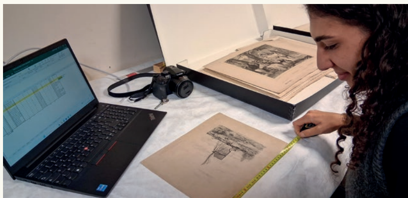
Camille Saunier mesurant un dessin de la collection documentaire

CS — La campagne de récolement s'est achevée pour les collections inscrites à l'inventaire. Depuis deux mois, elle s'oriente vers la collection documentaire, qui compose en partie la collection d'arts graphiques.