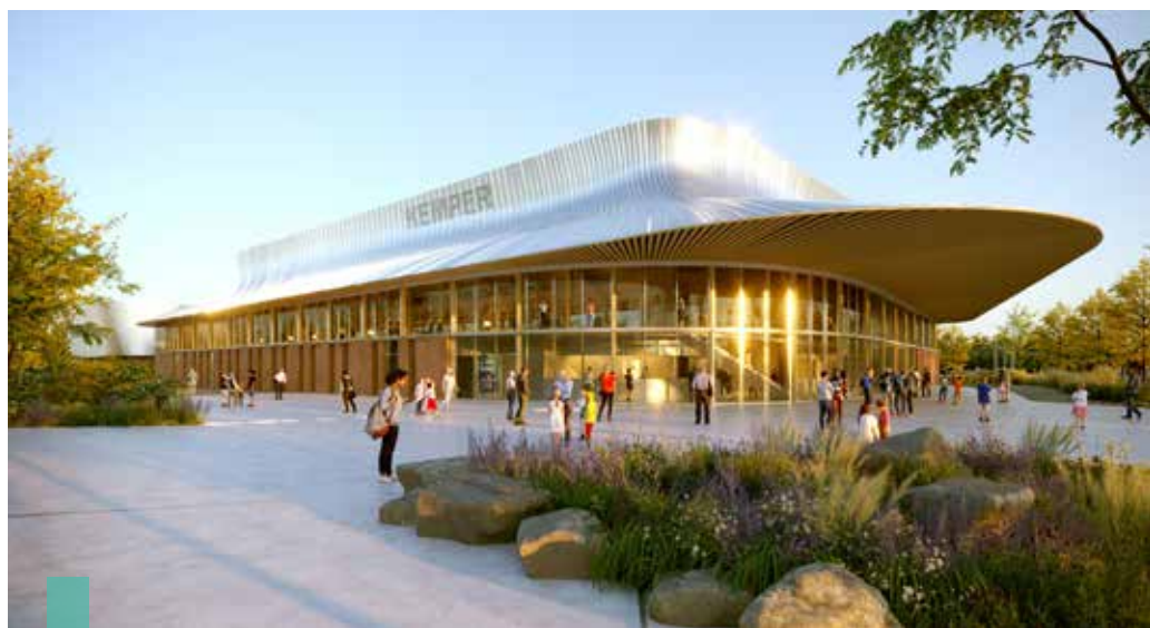
La salle événementielle aura de l'allure. Elle s'insérera harmonieusement sur le site.