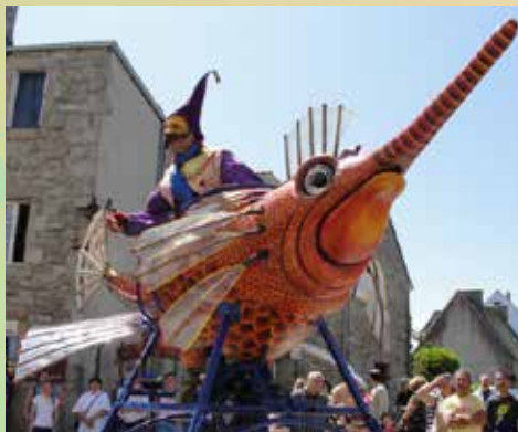
Le masque en mouvement

Elle est conduite par un drôle de personnage qui éparpille sa bonne humeur en interprétant un répertoire fait de chansons, histoires, poésies et sonnettes sur les poissons, l'eau et la mer.