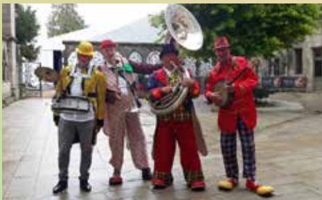
Ville de Quimper

Musique, chansons, gags, interactivité avec le public, ambiance garantie avec cette fanfare délirante constituée de quatre sympathiques clowns-musiciens qui accompagneront le Père Noël en goguette dans le quartier.