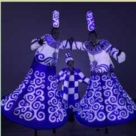
Compagnie Anime Tes Rêves

18h15 - Centre-ville - départ place Saint-Corentin Be Good And Light! Spectacle lumineux noctambulateur sonore. Ces bretonnes vous proposent de partir en voyage dans leur pays ou ailleurs, sous les étoiles... Larguez les amarres, ce sont elles qui tiennent la barre! Dentelles et lumières blanches, embarquez sur la Balade Bigouden Light. Voyagez légers dans un paysage océanique. Suivez la corne de brume et les lumières de la Capitaine. Elles mènent la danse, suivez la cadence!