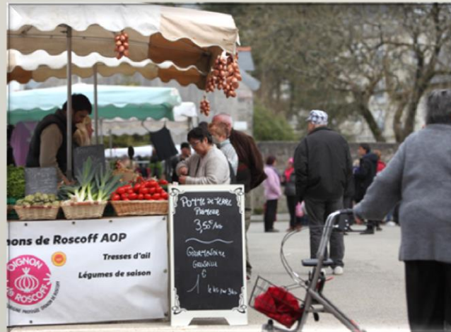
Mercredi 20 avril 2016