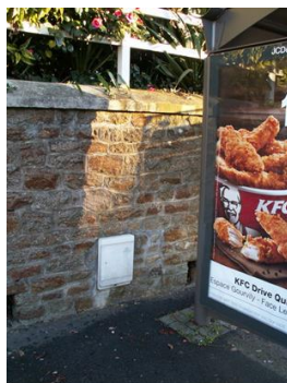
2 ème urne au n°98 abribus Foch

L'idée d'en proposer à quelques commerçants de l'Avenue de la France Libre est aussi émise.