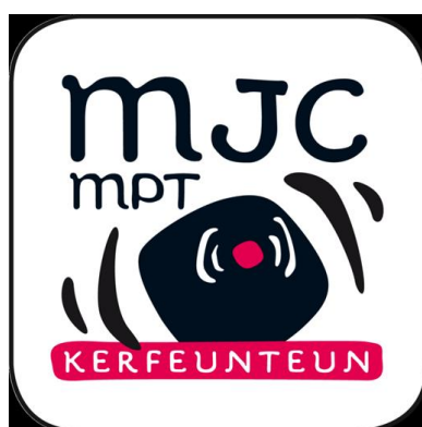
1 ère urne (électorale) à la MJC de kerfeunteun