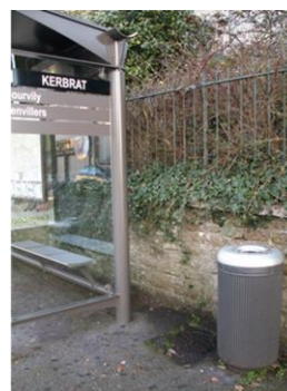
3 ème urne au n°66 abribus Kerbrat