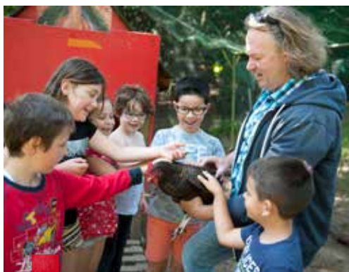
Les outils créés dans un cadre périscolaire comme le poulailler de l'école Yves-Le-Manhec servent de support pédagogique aux enseignants.

Les séances visent principalement à initier les enfants à la natation pour garantir leur aisance en milieu aquatique et ainsi garantir leur sécurité en bord de mer et de rivière.