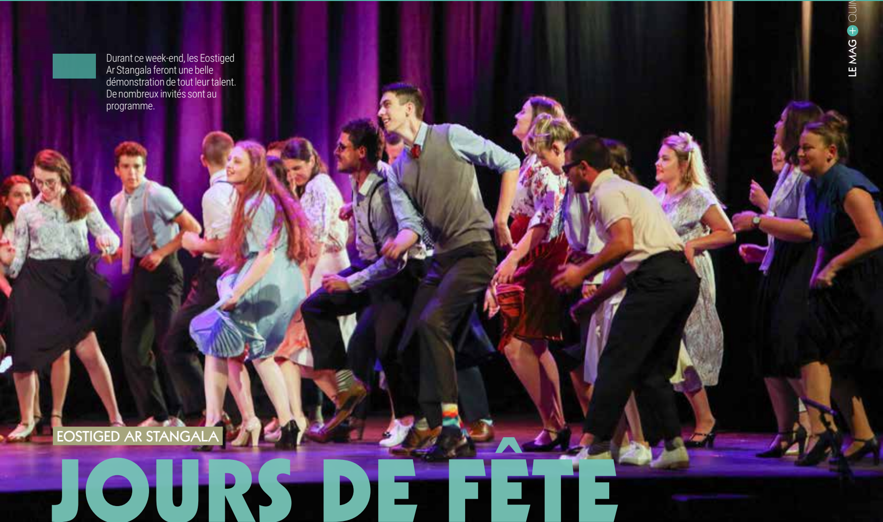
EOSTIGED AR STANGALA

Durant ce week-end, les Eostiged Ar Stangala feront une belle démonstration de tout leur talent. De nombreux invités sont au programme.