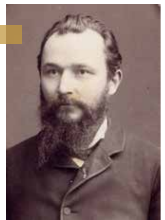
Portrait de Paul Néis vers 1885

La Société de géographie de Paris lui décerne une médaille d'or pour la qualité des informations collectées lors de ces explorations dans l'Indochine orientale.