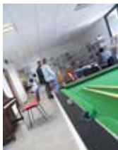
Photo de couverture : Les jeunes se retrouvent dans les médiathèques pour jouer et participer à des ateliers encadrés. Conseils, échanges et convivialité !

Un dra a bouez eo brudañ ar c'hinnig prederioù ivez. Anv zo, da skouer, da stourm a-enep an diouer a vedisined. Er c'heñver-se e vefe un dra vat, da'm soñj, krouiñ ur gevrat yec'hed lec'hel asambles gant holl obererien ar c'horn-bro, hag a c'hallfe bezañ astennet en tu-hont da harzoù an tolpad-kêrioù marteze deiz pe zeiz. Anez disoñjal, e mod ebet, e ranker plediñ gant ar c'henemprañ sokial evit an dud o devez diaesterioù dre ar skoazell da-zaout ul lojeiz. Pa vez diaes kaout ul lojeiz pe chom e-barzh e teu da vezañ diaes dezgas donezon ha startijenn d'ar gevredigezh.