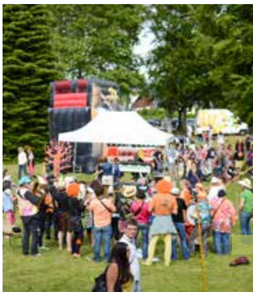
L'année dernière, la fête de quartier avait pour thème les années sixties.