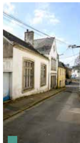
Certains bâtiments seront démolis pour créer la venelle de la Faïence.