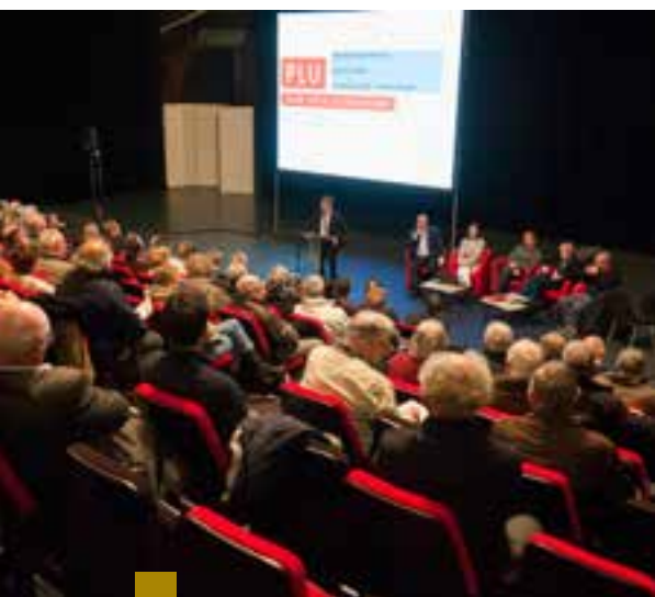
La concertation est au cœur du PLU, comme ici lors d'une réunion publique à Kerfeunteun.

Il présente les zones de développement économique (Gare, Kerdroniou, Kerjaouen, Kerlic, Hippodrome, Ty Ru), et les zones commerciales (centre-ville, périphérie). Il envisagera également les déplacements et les transports en commun.