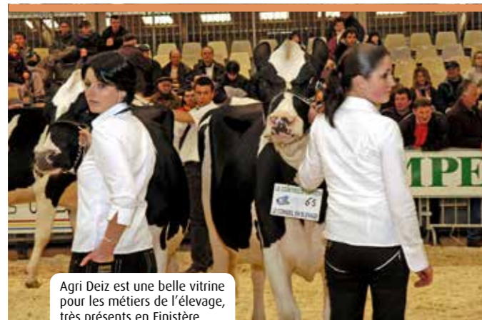
Agri Deiz est une belle vitrine pour les métiers de l'élevage, très présents en Finistère.

L'artisanat, l'agriculture, les entreprises sont à l'honneur en ce début d'année. Ces acteurs économiques font leur promotion à Quimper, à travers le festival de l'Artisanat, les Entrepreneuriales et Agri Deiz. Venez les découvrir !