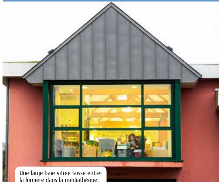
Une large baie vitrée laisse entrer la lumière dans la médiathèque.

Quand on évoque Plonéis, on ne pense pas forcément à sa médiathèque. Pourtant, le cadre agréable et spacieux de l'établissement invite à la découverte. Ici, on se rencontre, on se connaît. Au milieu des livres et des magazines, on prend le temps.