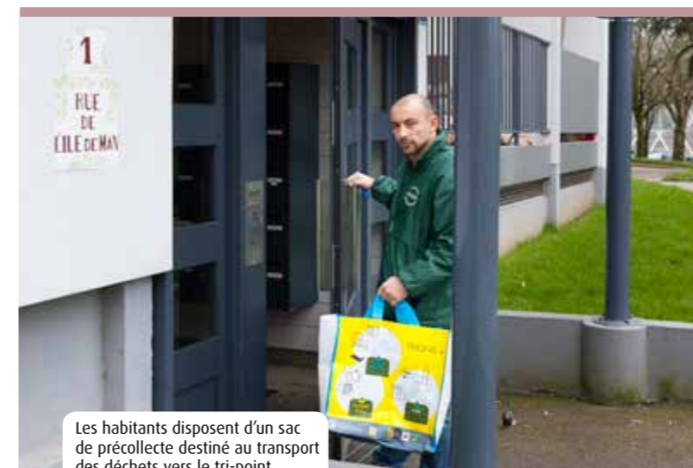
Les habitants disposent d'un sac de précollecte destiné au transport des déchets vers le tri-point.

C'est dans le quartier de Kerjestin / Kermoy-san (4 475 habitants en habitat collectif) que s'est déroulée cette opération. La collecte sélective s'y effectue grâce à l'apport volontaire en tri-points. Les services de Quimper Communauté avaient réfléchi avec l'association PIMMS*, les bailleurs, le centre social et la CLCV* aux freins au tri : pas de possibilité de stocker les déchets dans le logement, pas d'outil pour les transporter aux points de collecte, jugés parfois trop éloignés, la mobilité (une personne sur 2 a plus de 55 ans et/ou n'a pas de véhicule).