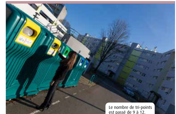
Le nombre de tri-points est passé de 9 à 12.

Quimper Communauté a lancé une nouvelle campagne de sensibilisation au tri sélectif et à la prévention des déchets. L'information en direct à l'occasion de porte-à-porte, la distribution de sacs de précollecte et de mémos ont été appréciées par les habitants, et suivies d'effets : les tonnages de tri sont en nette augmentation.