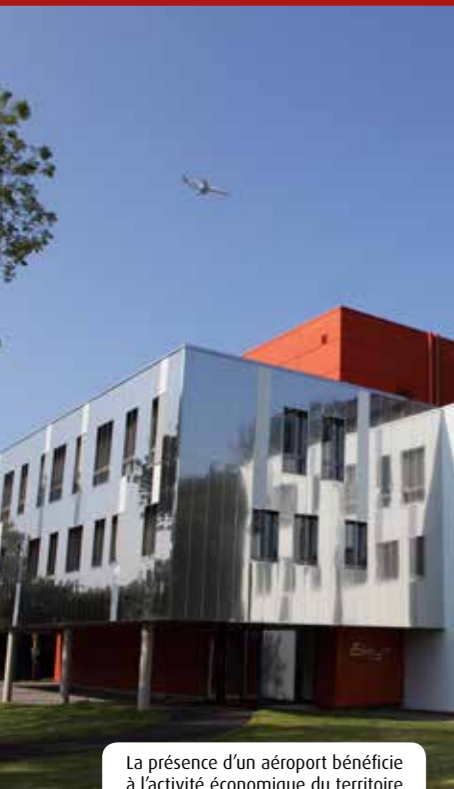
La présence d'un aéroport bénéficie à l'activité économique du territoire.