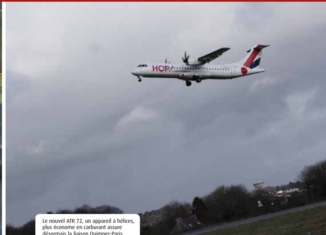
Le nouvel ATR 72, un appareil à hélices, plus économe en carburant assure désormais la liaison Quimper-Paris.

► d'accéder au reste de la métropole et aussi aux Antilles ou à La Réunion, avec un enregistrement des bagages de bout en bout. Sans oublier les offres tarifaires intéressantes (possibilité de billets à moins de 100 euros pour Paris). « L'avion est un moyen de transport rapide (on est à Paris en une heure trente), sûr et confortable », commente la directrice adjointe de HOP !. Autres avantages : la grande proximité du personnel de bord avec les clients, sur ces petits appareils (70 places), qui permet un service personnalisé et le fait qu'à l'Aéroport Quimper Cornouaille, on ne fait pas la queue.