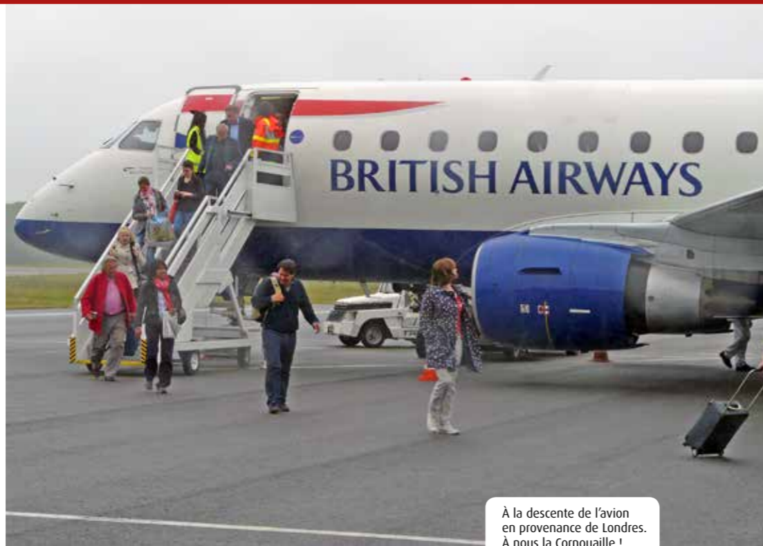
À la descente de l'avion en provenance de Londres. À nous la Cornouaille !