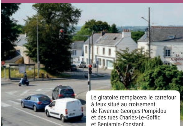
Le giratoire remplacera le carrefour à feux situé au croisement de l'avenue Georges-Pompidou et des rues Charles-Le-Goffic et Benjamin-Constant.

R emplacer un carrefour à feux par un giratoire améliore la sécurité de tous. À Ergué-Armel, la création d'un rond-point au croisement de l'avenue Georges-Pompidou, des rues Charles-Le-Goffic et Benjamin-Constant en est l'illustration. Les travaux viennent de débiter.