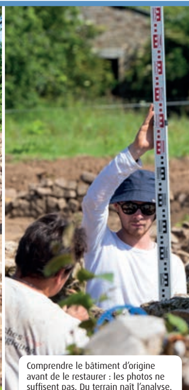
Comprendre le bâtiment d'origine avant de le restaurer : les photos ne suffisent pas. Du terrain naît l'analyse.

L e patrimoine antique de Plomelin sort progressivement de terre. Après l'ouverture au public des thermes de Pérennou en 2012, les fouilles de la villa romaine, située 450 m plus haut, se poursuivent.