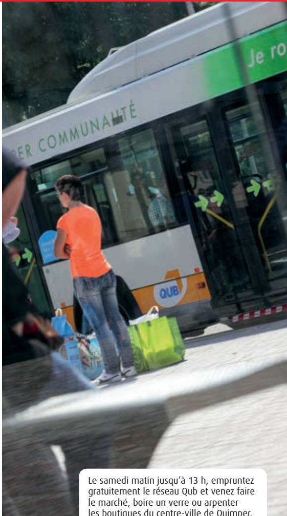
Le samedi matin jusqu'à 13 h, empruntez gratuitement le réseau Qub et venez faire le marché, boire un verre ou arpenter les boutiques du centre-ville de Quimper.