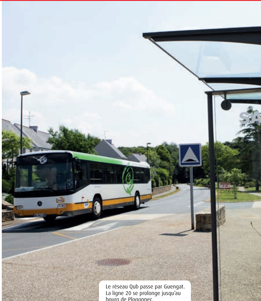
Le réseau Qub passe par Guengat. La ligne 20 se prolonge jusqu'au bourg de Plogonec.

mois de mai, pour fluidifier la circulation : le pont Sainte-Catherine rouvert au passage à la circulation automobile, les rues Gradlon et Elie-Fréron empruntées par les véhicules entre 7h et 9h (Attention, ces voies restent piétonnes, il s'agit d'une tolérance, les automobilistes se doivent d'être très prudents).