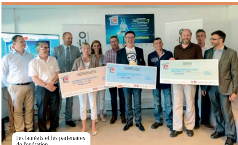
Les lauréats et les partenaires de l'opération

H ermineo a lancé le concours « I love la fibre » afin d'aider les entreprises du territoire à développer leurs projets d'usages numériques et de renforcer la notoriété du réseau d'initiative publique Très Haut Débit. Les lauréats ont remporté un raccordement à la fibre optique, ainsi qu'une offre promotionnelle de services auprès d'un opérateur partenaire.