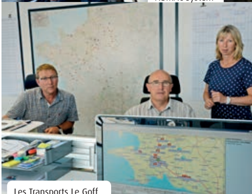
Les Transports Le Goff