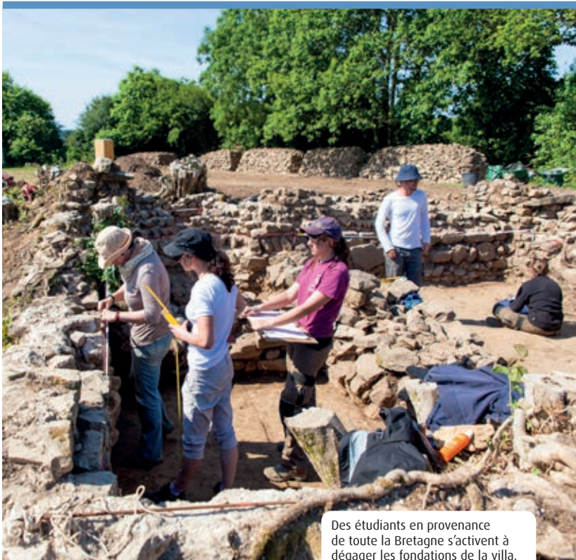
Des étudiants en provenance de toute la Bretagne s'activent à dégager les fondations de la villa.