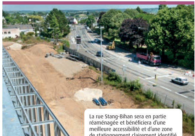
La rue Stang-Bihan sera en partie réaménagée et bénéficiera d'une meilleure accessibilité et d'une zone de stationnement clairement identifiée.