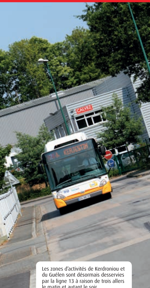
Les zones d'activités de Kerdroniou et du Guélen sont désormais desservies par la ligne 13 à raison de trois allers le matin et autant le soir.