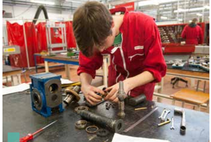
Le Likès dispose de matériels performants en phase avec la réalité du monde de l'entreprise.

15 heures hebdomadaires d'enseignement professionnel: les lycéens acquièrent un vrai savoir-faire.