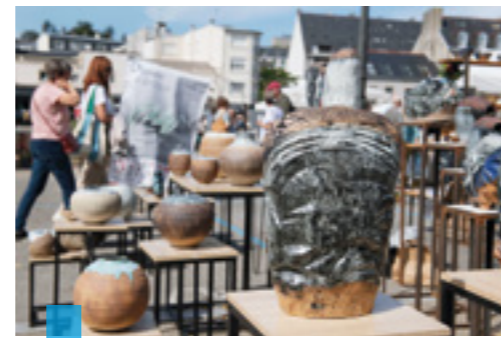
Tradition et modernité sont réunies lors du festival Quimper Céramique.

Les 5 et 6 septembre, le festival Quimper Céramique s'installe dans le quartier de Locmaria ! Une quarantaine d'exposants y dévoile un art unique où l'héritage traditionnel dialogue avec la céramique ultra-contemporaine. À ne pas manquer, les œuvres de Daniela Schlagenhauf et William Byl au prieuré, et Marie Rancillac place du Stivel. Ateliers, rencontres et deux conférences sur le thé ponctueront ce week-end créatif ! https://quimperceramique.com