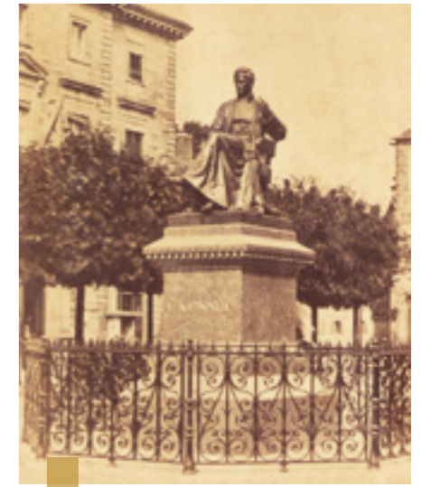
À l'origine la statue était protégée par une grille en fer forgé.

Le stéthoscope est utilisé par les médecins pour écouter les bruits du cœur et de la respiration. Pour rendre hommage au docteur Laennec, une statue est inaugurée en 1868 place Saint-Corentin. Pendant la guerre 39-40 la statue devait être fondue pour faire des canons. Mais la mairie s'est opposée à sa destruction.