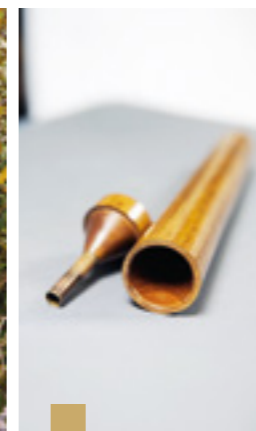
Le stéthoscope de Laennec.