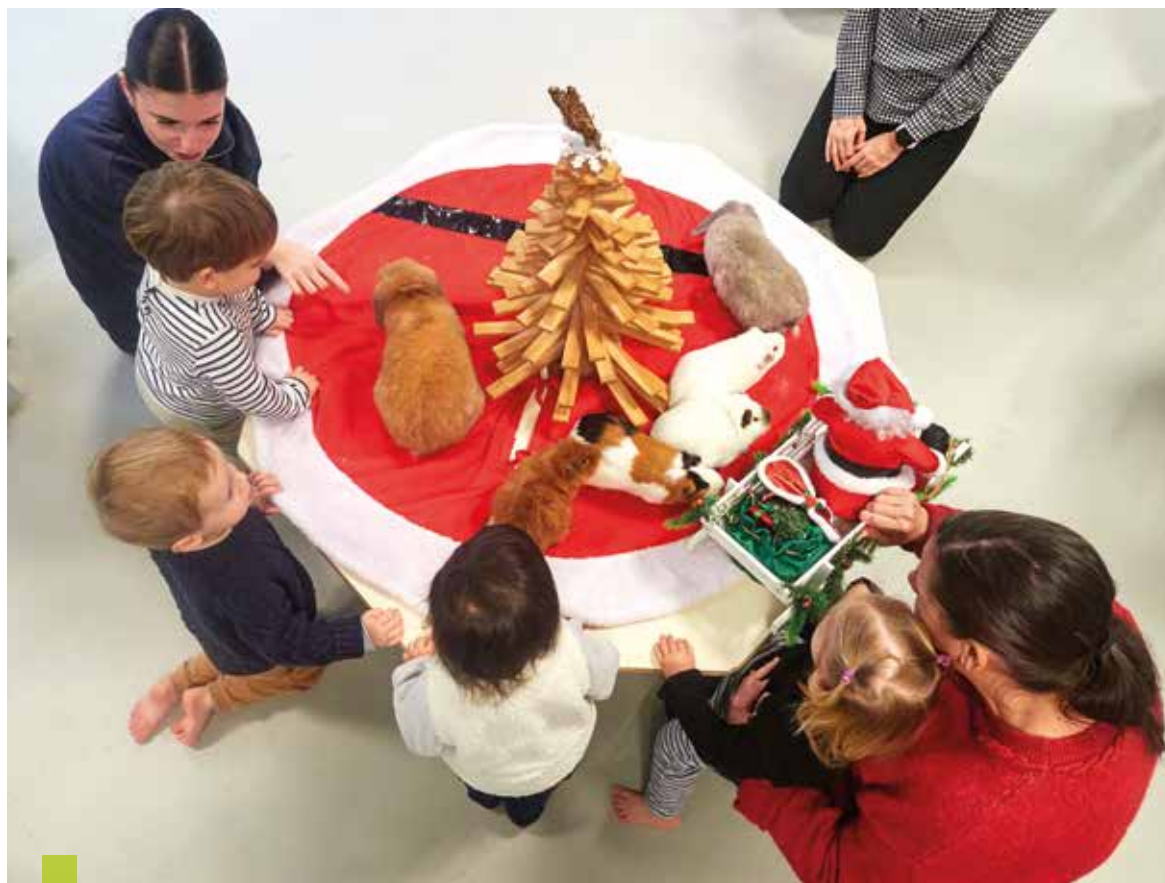
Avec la médiation animale, l'enfant apprend qu'il ne peut pas faire n'importe quoi avec l'animal. Il doit adapter son comportement et ses gestes pour entrer en relation, ce qui travaille ses capacités d'inhibition et de douceur.

Pour certaines familles, la garde à domicile (emploi direct ou entreprise prestataire) complète encore le panel, avec toutes les informations pratiques recensées par le Relais de la petite enfance et dans le guide pratique dédié.