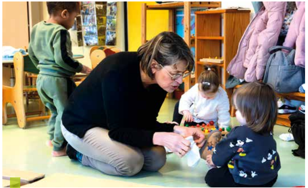
S'amuser, découvrir, s'émerveiller, apprendre, les structures d'accueil rivalisent de projet pour favoriser l'éveil et le bien-être des enfants de moins de trois ans.

Les haltes-garderies du territoire et certaines structures offrent un accueil occasionnel, voire d'urgence, avec un fonctionnement pensé pour être très souple. Pour la maman d'Azélie, le choix était clair : « En tant que profession libérale, j'ai trouvé la flexibilité apportée par la halte-