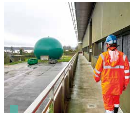
La réhabilitation de la station d'épuration du Corniguel est programmée.

À Quimper, les travaux sur la station d'épuration du Corniguel démarreront fin 2026 (voir encadré). Par ailleurs, un projet d'ampleur est à l'étude, tant par l'investissement (environ 20 millions d'euros) que par le chantier : la réorganisation du poste de refoulement des eaux usées situé au bout du chemin de halage, dont l'état est particulièrement dégradé. Il s'agit de sortir de la zone naturelle de l'Odét afin de prévenir le risque de pollution du fleuve. Comment par ailleurs éviter les infiltrations d'eaux parasites (pluie...), qui n'ont pas besoin d'être traitées, dans les réseaux d'assainissement ? C'est l'une des priorités du schéma directeur des eaux usées élaboré par Quimper Bretagne Occidentale, qui sera terminé en juin. Il permettra de cibler plus efficacement les travaux. En parallèle, la collectivité étudie comment faire concorder le développement de l'urbanisation et les exigences d'assainissement, afin de desservir au mieux les projets. Là comme ailleurs, il est indispensable d'anticiper autant que possible.