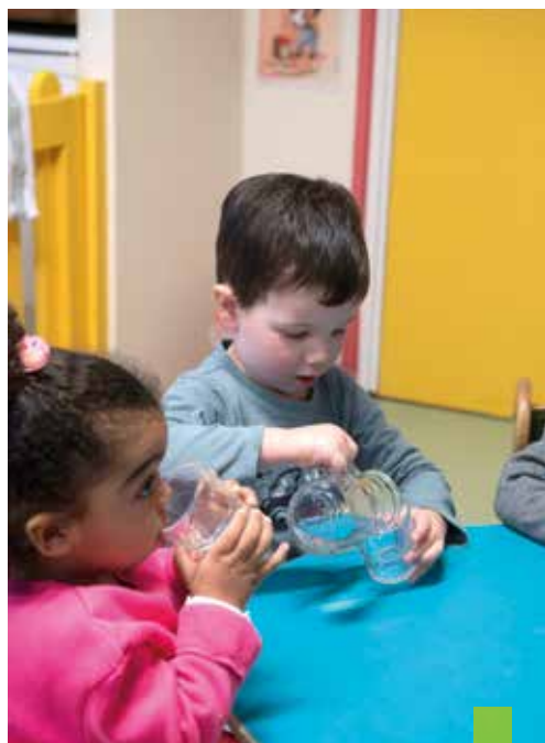
Accueil familial à Kerfeunteun. Apprendre à boire dans un verre n'est pas évident pour les petits, alors ils s'entraînent !

Pour assurer la continuité du service, même