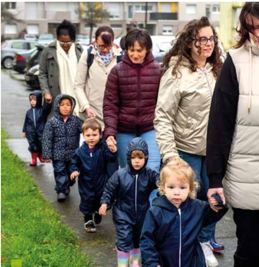
Les Petits Mousseux n'ont pas peur du mauvais temps. Bien équipés ils sont prêts à affronter la pluie.

Pour tout renseignement, les familles peuvent contacter le Relais Petite Enfance – Pôle Enfance, 9, rue du Maine à Penhars (Quimper) : Tél. 02 98 98 86 51 mail : rpe.ouest@quimper-bretagne-occidentale.bzh Retrouvez plus d'informations et consultez le guide de la petite enfance sur le site www.quimper-bretagne-occidentale.bzh