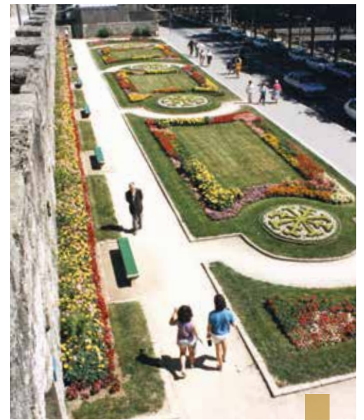
Le jardin en 1988.

POURMENADENNOÙ : Promenades, LIORZH-KÊR : Jardin public, ARZOUR : Artiste.