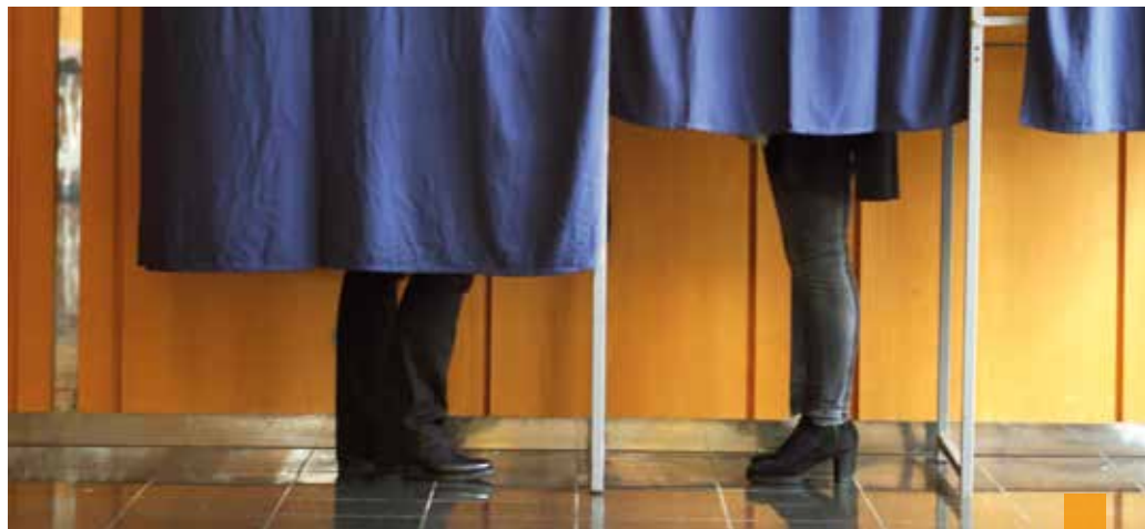
Les bureaux de vote sont ouverts de 8h à 18h.

La ville de Quimper lance un appel à volontaires pour devenir assesseur dans un bureau de vote, à l'occasion des élections municipales. La seule condition : être inscrit sur la liste électorale de Quimper. Inscriptions auprès de la mairie, tél. 02 98 98 87 18 ou par mail : relations.publiques@quimper.bzh