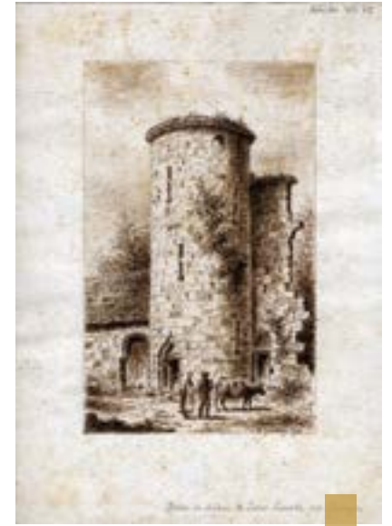
Le château de Saint Alouarn par Louis Le Guennec.

calvaire à trois croix, élevé au XVI e siècle, qui inspira notamment le peintre et poète Max Jacob. Un ossuaire accolé à la façade ouest de l'église de 1557 complète ce bel ensemble monumental où est gravée une sentence latine, « Respice finem », invitant le passant à songer à sa fin dernière.