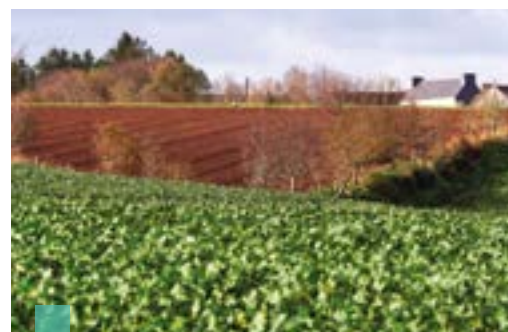
Des haies ont été plantées pour freiner le ruissellement.

Des endiguements en amont de Quimper et dans les zones exposées le long de l'Odet ont été réalisés.