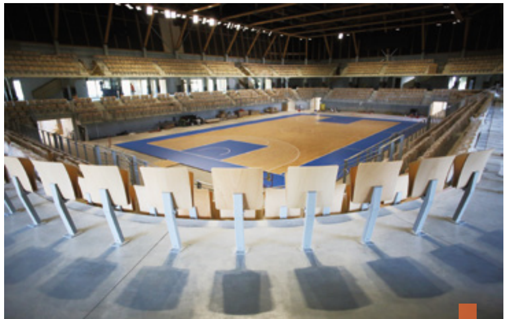
L'aménagement de la grande salle a permis de mettre en avant le savoir-faire des entreprises locales.

L'engagement écologique du projet frappe par son ampleur : construction bas carbone, charpente en bois, murs en terre crue,