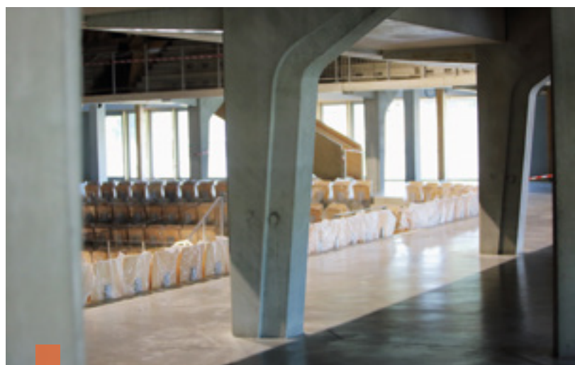
Les déambulations sont facilitées à l'intérieur du bâtiment, pour une expérience immersive...

chaufferie bois, récupération des eaux de pluie et bientôt des panneaux photovoltaïques sur 500 m 2 de toiture. La grande salle s'inscrit dans la transition écologique, avec des engagements forts dans l'exploitation.