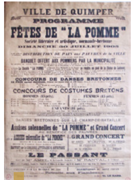
Affiche pour la Fête de la Pomme de 1905.