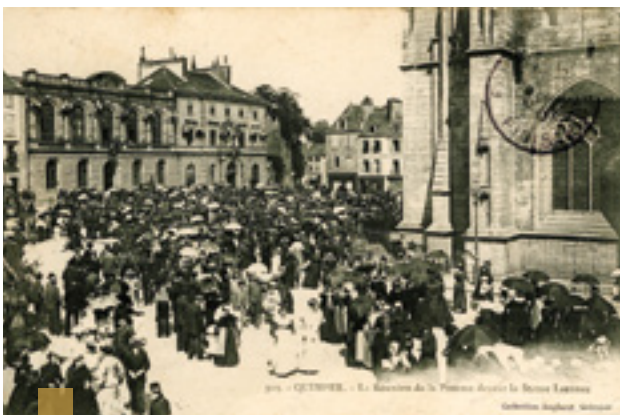
Réunion de la Pomme 1905, la foule au pied de la statue de Laennec venue assister à un concours d'éloquence.

AVAL : Pomme, LOKAÑS : Éloquence, KEVREDIGEZH : Société