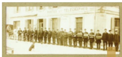
Les facteurs de Quimper en 1898 devant la Poste principale.

La Poste prit à bail en 1894, au confluent du Steir et de l'Odet, un ancien comptoir d'escompte. Le bail d'une durée de 27 années expirait le 31 mars 1921. Au fil des années, les plaintes de l'administration se multiplièrent face à l'état de délabrement général du bâtiment : « misérable bureau, sombre, étouffant l'été, froid l'hiver ». Un autre rapport, adressé au conseil municipal, le décrit fort pittoresquement comme : « un local qui loin de contribuer à l'embellissement de la ville est, de la part des voyageurs et des touristes, un objet de conversation et de surprise d'où l'admiration est bannie. Le bureau de poste de notre ville menace de devenir légendaire et en vérité, vous n'en trouverez pas deux autres qui soient plus délabrés, moins esthétiques ou encore aussi laids que celui qui s'élève au confluent du Steir et de l'Odet ». Il faut dire que dans le contexte politique et religieux de l'époque (celle de la séparation des Églises et de l'État), les relations entre le bailleur et le locataire sont devenues difficiles. Le propriétaire, M. de Ploec, est un monarchiste, soutien du cléricisme local, étiqueté politiquement comme réactionnaire.