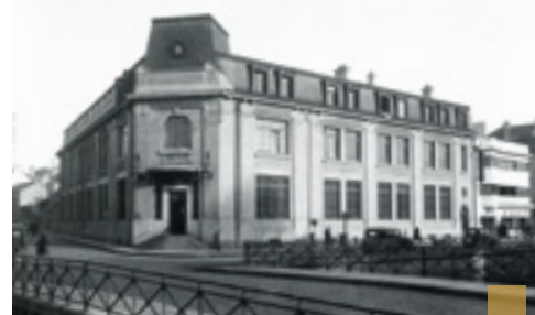
Photo du haut : projet de poste central - 43 M 1 Photo du bas : la nouvelle poste en 1930 - 40 Fi 497