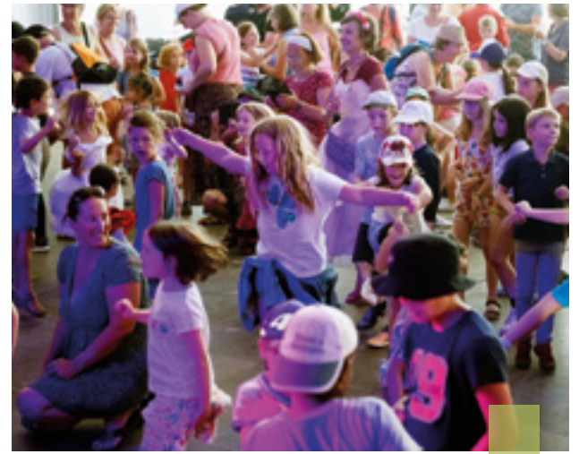
Les festival Les Enfants sont des princes fait le plein de spectacles et de bonne humeur.

Les 11-17 ans pourront aller à la Récré des 3 curés, à la plage, construire des fusées à eau, faire de la cuisine... tandis que 6-10 ans iront à Odet Loisirs, Creac'h Gwen, etc. En famille, une sortie aura lieu aux Terres de Nataé, et une virée vers Les Etocs au large de Penmarc'h pour observer les phoques.