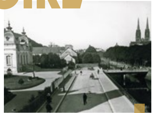
Le nouveau boulevard et son pont en 1905 - 5 Fi 45

Les quais de Quimper ont connu plusieurs vies. Au Moyen Âge, les quais sont un port de commerce. Du vin et des céréales sont amenés par bateau. Au 18 e siècle, les quais sont des lieux de promenade. Au 19 e siècle, on construit la gare et de belles maisons. Chaque maison a sa passerelle privée pour traverser l'Odet. Les quais actuels ont été aménagés dans les années 1960.