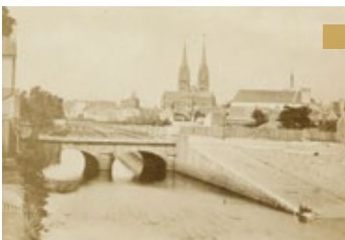
Les quais du futur boulevard de Kerguelen (quais Napoléon III) vers 1870, notez la cale du pont Firmin aujourd'hui disparue 25_Fi_043

Le plan directeur d'urbanisme de 1962 prévoit la création d'un boulevard complet sur la rive gauche de l'Odet. Le projet est déclaré d'utilité publique en 1964. Plusieurs jardins et d'anciens hôtels particuliers sont sacrifiés sur l'autel de la modernité. Le cinéma Odet Palace est démoli. Finalement, le 1 er juillet 1969, les deux tronçons sont enfin réunis. Le boulevard Duplex permet désormais une libre et complète circulation le long de l'Odet.