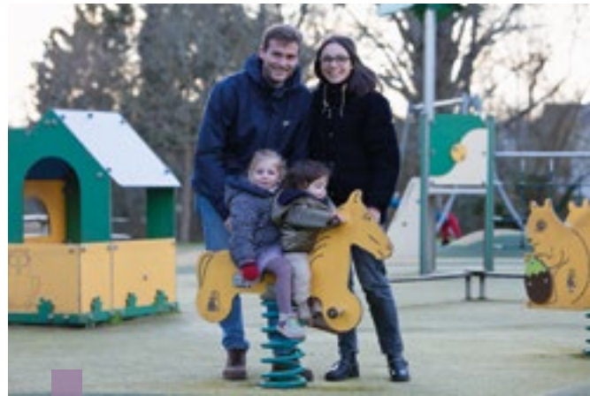
Une famille heureuse de vivre sur un territoire à taille humaine où il est facile de nouer des contacts.

Plusieurs centaines de postes seront à pourvoir dans les trois prochaines années sur le territoire dans le domaine de l'énergie décarbonée. En effet, des entreprises de pointe s'y développent, notamment Axon' Mechatronic, Blue Solutions, Enag, EERI électricité, H2Gremm, Groupe Snef ou encore Entech, accueillie à la pépinière des innovations en 2016, et qui affiche en 2024 un chiffre d'affaires de 45 millions d'euros. En lien avec la Région, Quimper Bretagne Occidentale se mobilise pour identifier leurs besoins en recrutement, faire connaître cette filière émergente, adapter les formations initiales et continues, inciter des salariés à s'y investir de façon pérenne.