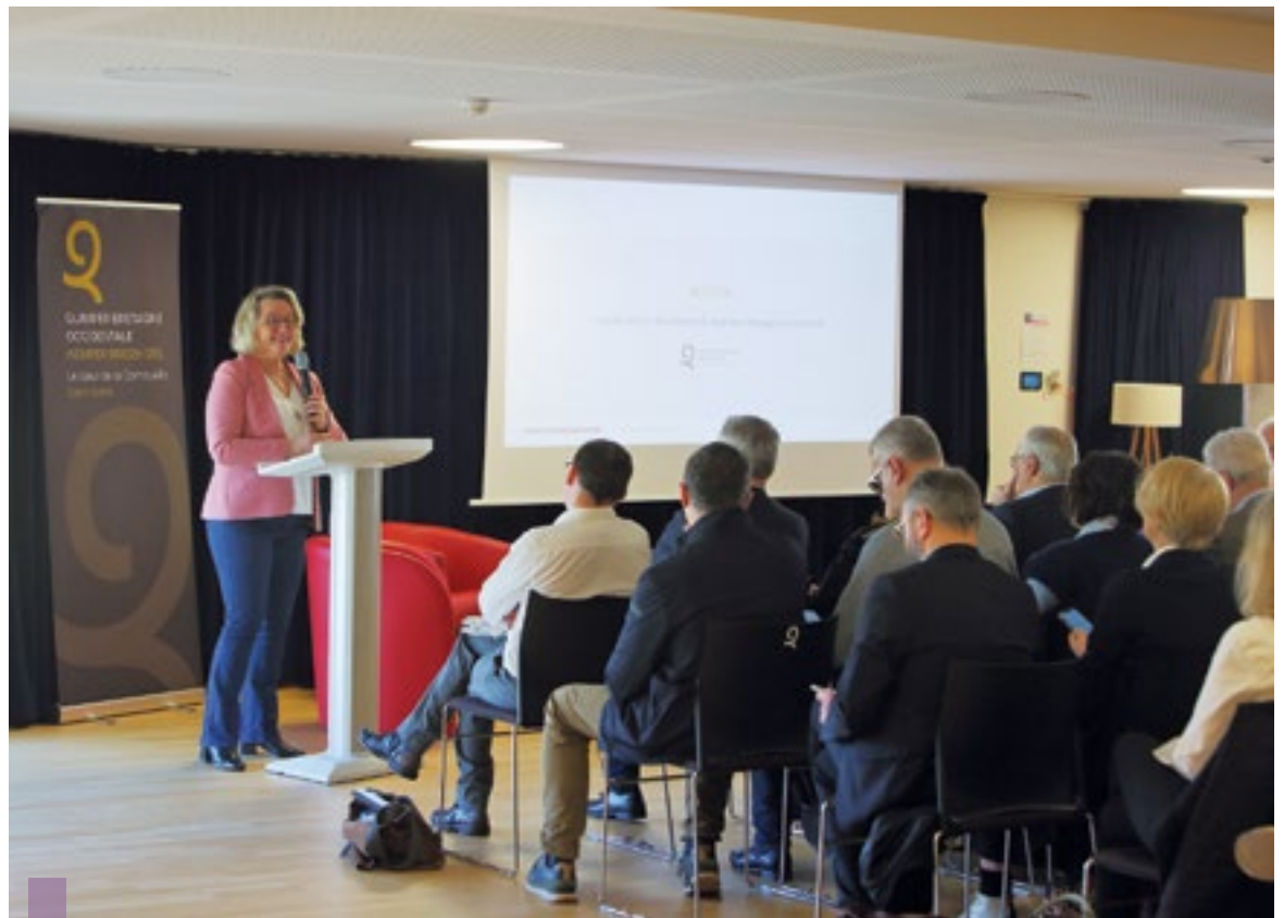
La 7 e réunion du comité Impulsion Cornouaille a permis la création d'une plateforme d'accompagnement opérationnel et de soutien aux entreprises du territoire, consacrée notamment aux problématiques liées au recrutement.

qui lui assure une certaine résilience face aux conjonctures du marché.