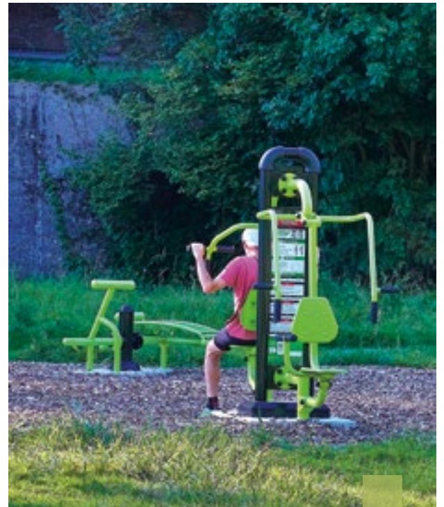
Grâce au budget participatif, les sportifs disposent d'une nouvelle aire d'entraînement à Tréqueffelec.