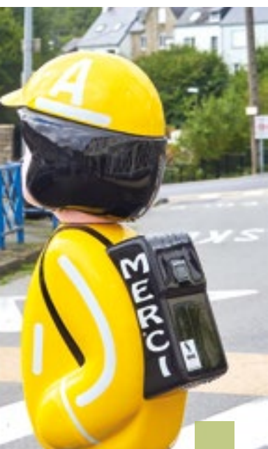
Prêtes à traverser, ces figurines géantes incitent les automobilistes à ralentir aux abords de l'école Jean-Monnet.