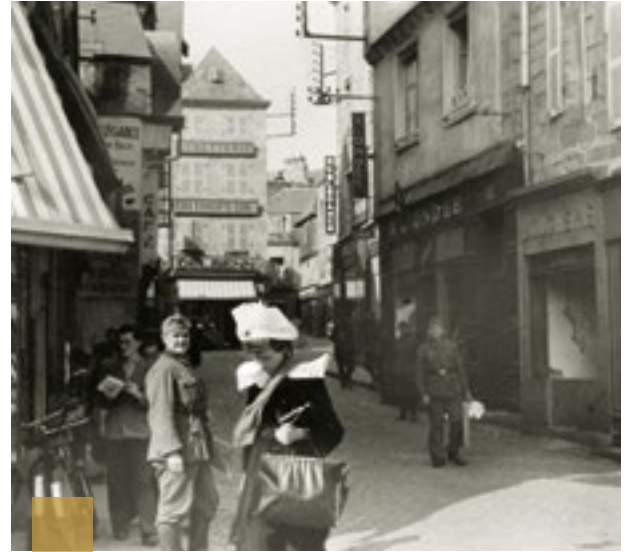
Rue Saint-François. Une jeune bretonne détourne les yeux du photographe allemand.

Si vous avez des documents de famille sur la guerre 39-45, vous pouvez contacter le service au 02 98 98 87 61.