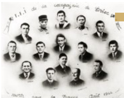
Coll. Le Brun - Les tués de la Cie de Brieç en 1944.

Contact : Service des archives municipales et communautaires de Quimper Adresse topographique : 10 bis rue Verdelet 29000 Quimper, 2 e étage. Adresse postale : Service des Archives, mairie de Quimper, CS 26004 29107 Quimper Cedex. Accueil physique pour des dons ou prêts de documents les mardi, jeudi et vendredi de 8h30 à 12h et de 13h30 à 17h30. Tél. 02 98 98 87 61 Courriel : archives@quimper.bzh