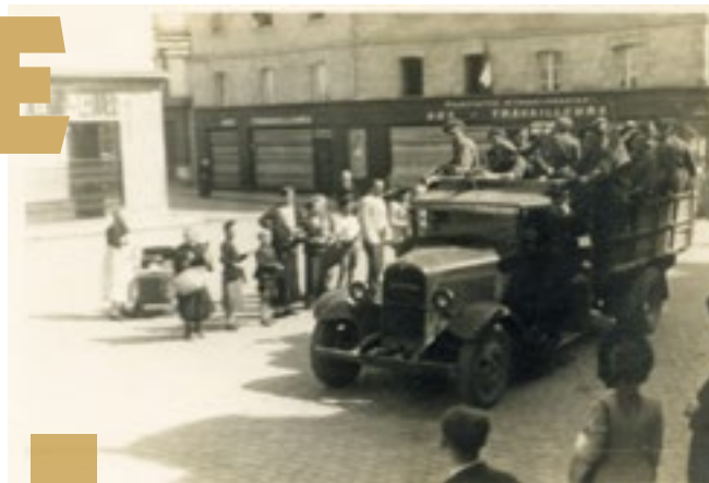
Entrée des FFI dans Quimper 1944

On construit un monument en mémoire de cette journée.