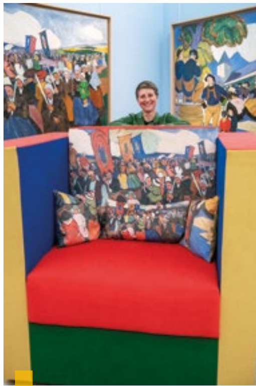
Un fauteuil XXL inspiré du célèbre décor de Ker-Moor de Pierre de Belay permet aux visiteurs d'observer le décor monumental.

Né à Quimper en 1890, Pierre de Belay est considéré comme l'un des artistes peintres les plus doués de sa génération et un extraordinaire coloriste. Cette exposition, la première dédiée exclusivement à son œuvre au musée des Beaux-Arts depuis 1988, présentera environ 200 pièces. Les visiteurs auront la chance unique de découvrir des œuvres rarement exposées ou inédites. Dans des styles variés, l'artiste a multiplié les études de la vie parisienne et a su donner un nouvel élan aux thèmes traditionnels de la peinture bretonne. Son sens de l'observation et son talent de dessinateur ont trouvé leur parfaite expression