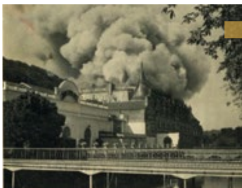
La préfecture incendiée par les Allemands, 1944.