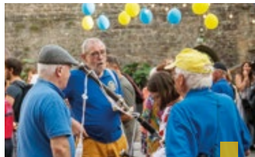
Une soirée de soutien au peuple ukrainien le 24 août.

Entrée libre. Buvette et restauration sur place avec des spécialités ukrainiennes. Plus d'informations : 06 33 77 58 76.