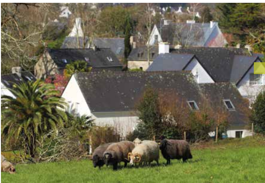
Eco-pâturage avec les moutons au Corniguel.

Cet outil collaboratif n'aurait pas pu voir le jour sans l'implication des associations et des citoyens. Ainsi, vous avez peut-être participé à l'un des six Défis-Nature, challenges qui invitaient les habitants à signaler la présence d'escargots, de reptiles, de renards, d'oiseaux d'eau ou de salamandres sur le territoire ? Car c'est cela aussi, faire société : devenir acteur ou actrice de son propre territoire ! Concours photos, animations enfants, sorties d'observation... Les initiatives, nombreuses pendant ces deux ans, ont suscité un bel engouement.