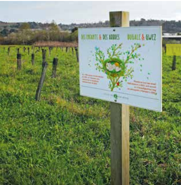
Des enfants et des arbres a permis la plantation de 1000 arbres en 2023.