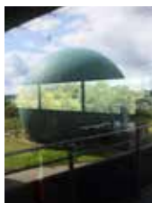
Photo de couverture : La ville de Briec fait figure de pionnière. Elle a très tôt mis en place une chaufferie bois pour notamment sa piscine AquaCove.