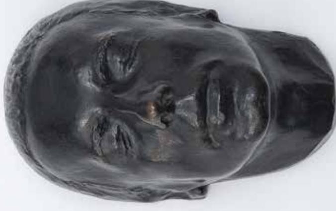
Iché - Masque Paul Eluard © Adagp, Paris 2023

Conçue comme un dialogue du ciseau et de la plume, la nouvelle exposition du musée des Beaux-Arts de Quimper rend hommage au sculpteur René Iché (1897-1954) et retrace l'influence durable et féconde du mouvement littéraire surréaliste sur son travail. À partir du 23 novembre, on y contempera une centaine d'œuvres, souvent inédites, de cet artiste engagé, proche de Max Jacob et Apollinaire.