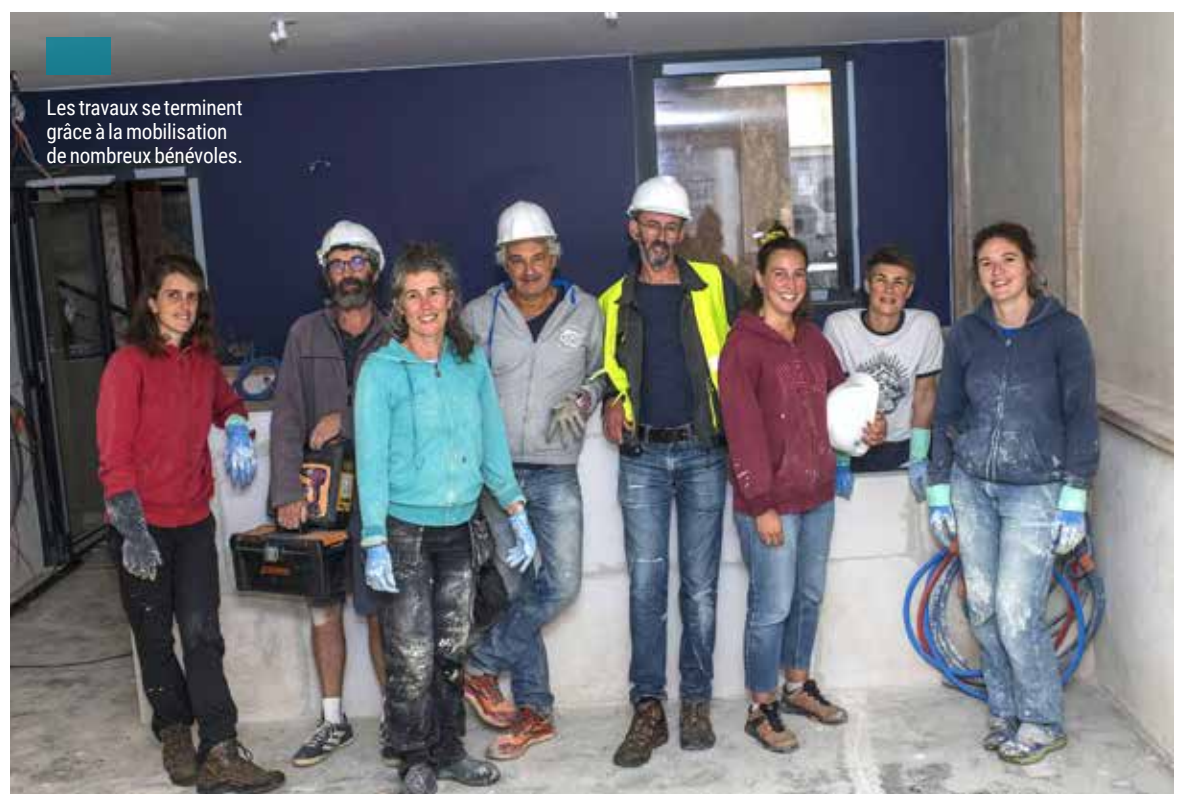
Les travaux se terminent grâce à la mobilisation de nombreux bénévoles.

Le Flux : 3, rue du Cosquer à Quimper et sur www.flux.bzh