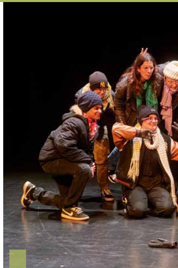
La MPT de Kerfeunteun propose cet été un atelier théâtre pour les ados.

À la MPT d'Ergué-Armel, l'espace familles et habitants a concocté des « Rendez-vous des vacances au Braden » avec des espaces aménagés pour tous les âges et des activités quotidiennes, des sorties ainsi que des soirées « Guinguette au Quinquis ».