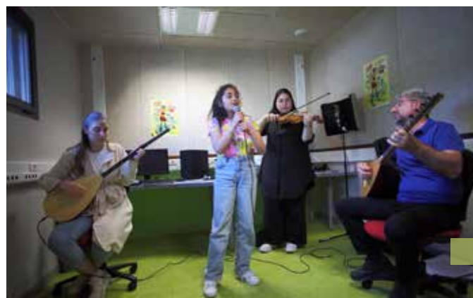
Le Local Musik reste ouvert tout l'été (ici, répétition de l'orchestre national de Penhars).

la vie à la ferme à Crozon, le vélo en itinérance sur le canal de Nantes à Brest.