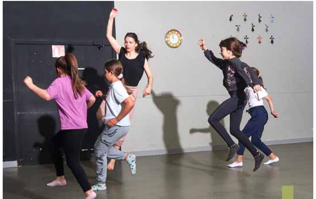
La MPT d'Ergue-Armel a mis au point un programmes d'activités très diverses (ici, un atelier danse).

La Maison de quartier du Moulin-Vert ouvre son centre de loisirs tous les jours pour les 6-12 ans. L'espace jeunes (10-17 ans), en ouverture libre tous les après-midi, proposera des activités à la journée. Des séjours permettront de découvrir