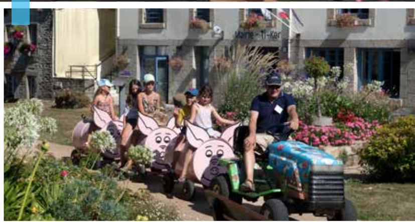
Balade à bord du petit train à Plogonnec lors du festival Les enfants sont des princes.

Guengat (MAG), soutenu par la municipalité, ils trouveront des produits alimentaires locaux, des productions artisanales et culturelles, sans intermédiaire et en circuit court. Au stade de Ty-Eugène de Briec , les étoiles seront dans le ciel et sur grand écran le vendredi 7 juillet pour une séance de cinéma en plein air prévue à 22 h 30. Les enfants pourront profiter des structures gonflables avant la projection du film choisi par les habitants. À Ergué-Gabéric , la base de loisirs de Croas-Spern accueillera le public du 6 juillet au 26 août avec tous les jours de nombreuses activités à découvrir.