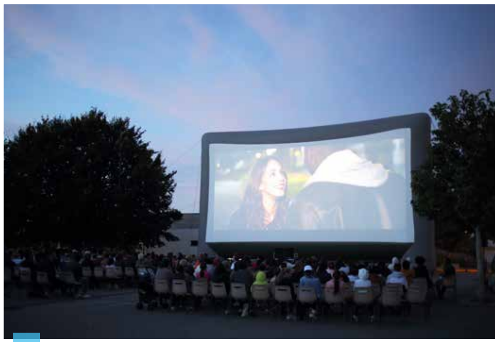
Briec fait son cinéma (en plein air) le 7 juillet.