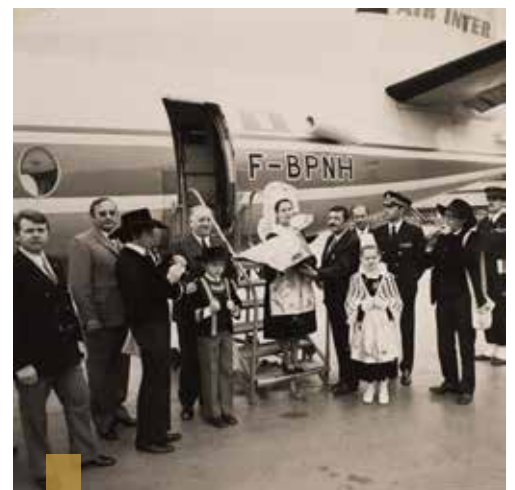
Les reines ont représenté la Bretagne à l'occasion de nombreux événements.

De nombreuses pièces du Festival de Cornouaille, parfois considérées par les propriétaires comme banales, sont pourtant des trésors pour les historiens et méritent d'être conservées. Afin de leur redonner vie, les archivistes municipaux ont initié une grande collecte d'archives en lien avec le festival et invitent les propriétaires à les contacter. Tél. 02 98 98 88 41