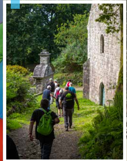
Sur les chemins de l'été à Locronan...