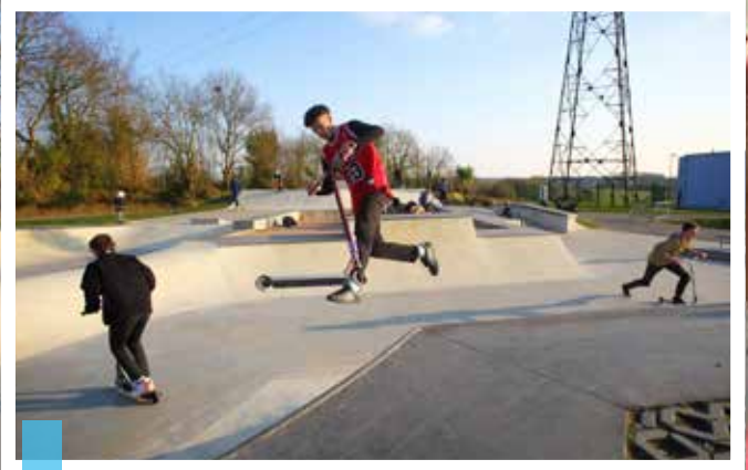
Skatepark tout l'été à Ergué-Gabéric

P endant la période estivale, les communes de Quimper Bretagne Occidentale et les associations font preuve de créativité pour proposer aux touristes et aux habitants des animations attractives. Temps fort de l'été, le festival « Les Enfants sont des princes » animera des lieux emblématiques de onze communes de l'agglomération du 1er au 11 août : Briec, Ederne, Ergué-Gabéric, Guengat, Landudal, Locronan, Plogonnec, Plomelin, Plonéis, Pluguffan et Quimper. Près de 25 spectacles et animations sont au programme, comme « Attention, Dragons ! » à Plomelin le 3 août, ou des animations festives dans le cœur piétonnier du bourg de Plogonnec pour le plus grand plaisir des enfants : balade petit train, création de bijoux, animations foraines, poneys, etc. À Locronan , les touristes et les habitants de l'agglomération pourront randonner « Sur les chemins de l'été » le 7 juillet et découvrir les trésors de la petite cité de caractère. Le village de Locronan a souvent servi de décor naturel au cinéma. Cette belle histoire se poursuivra du 21 au 30 juillet à l'occasion de la 3 e édition du Festival du cinéma de Bretagne. À Guengat , la nouvelle aire de camping-car dispose de six places et de toutes les commodités nécessaires, elle permettra aux amateurs de « vanlife » de rayonner dans l'agglomération et au-delà. Au Magasin associatif de