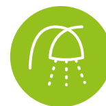
Aide à l'autonomie

Un support précieux pour les personnes âgées et leur famille, d'autant que des aides existent pour mettre en œuvre ces services. Ainsi, toutes les prestations sont déductibles du montant des impôts à hauteur de 50 %. Et les personnes dépendantes peuvent bénéficier de l'allocation personnalisée d'autonomie, ou de la prestation de compensation du handicap, qui permettent de financer en partie ces prestations. Sans compter que les services apportés par Petits-fils sont très flexibles. En effet, si les heures et jours de passage sont fixés à la convenance des personnes aidées selon leurs besoins, il suffit de prévenir pour les modifier, les suspendre, ou les arrêter. Enfin, tous les services de Petits-fils sont sans engagement de durée ni frais d'inscription. Une bonne raison d'essayer.