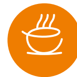
Aide aux repas