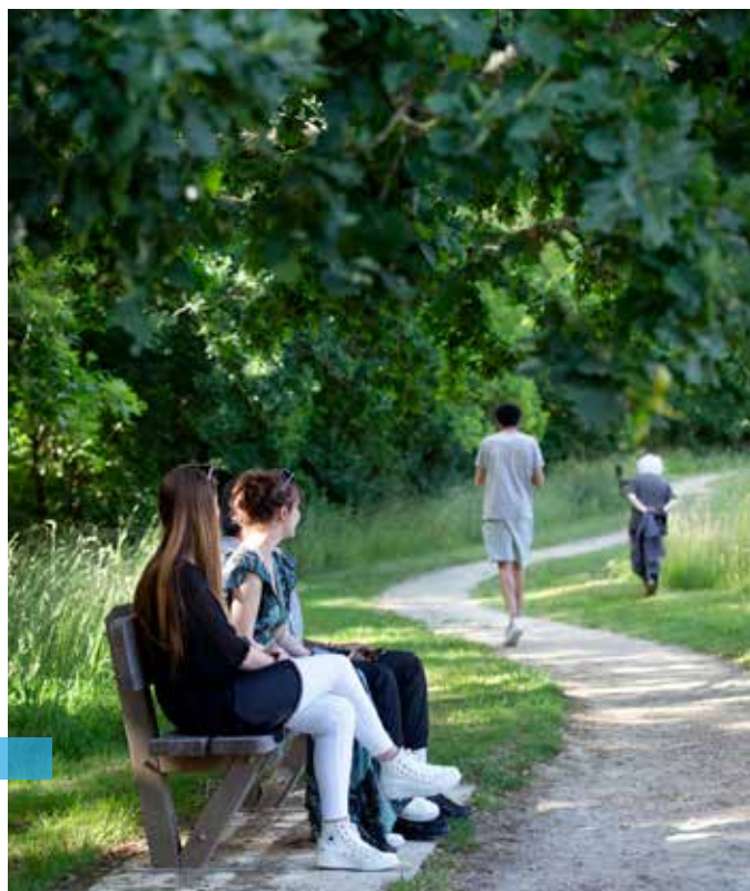
De nouveaux bancs font leur apparition, à la demande des habitants (ici, au Moulin-Vert). D'autres suivront.

L a démocratie participative est une priorité de la ville de Quimper. Les élus associent les habitants à la réflexion sur les grands enjeux comme sur les réalisations concrètes dans les quartiers. De très nombreux outils sont mis à disposition pour que chacun puisse donner son avis, faire connaître ses attentes, suivre les actions enclenchées. Et cela fonctionne ! Grâce à cette nouvelle méthode de coconstruction des politiques publiques, les Quimpérois ont pu s'exprimer sur différents sujets.