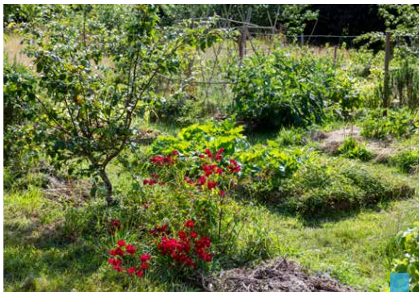
La collectivité prend en compte les demandes des habitants de nouveaux jardins partagés ou familiaux (ici, le jardin potager partagé Courgettes et Compagnie).