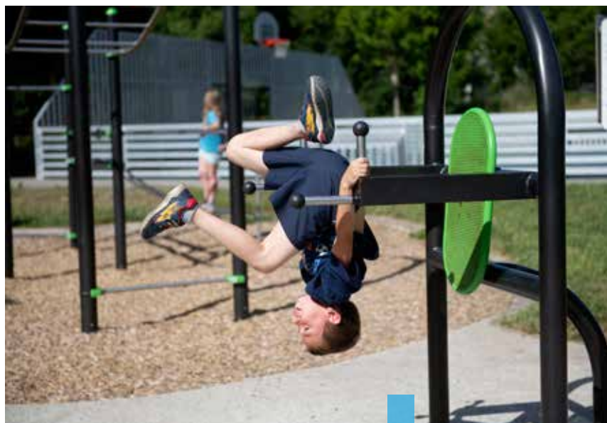
Les Quimpérois plébiscitent les aires de jeux : des projets sont en cours, dont un près de la mairie de Kerfeunteun.