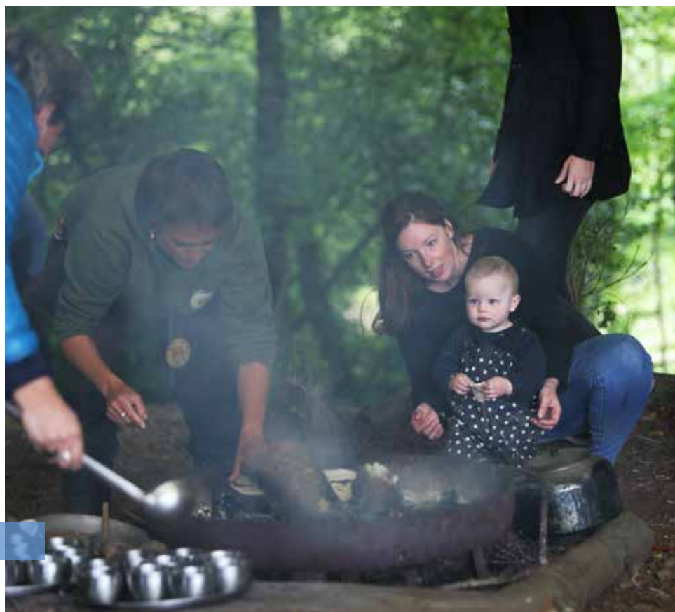
"De mots et de lait", des histoires racontées aux bébés de 0 à 9 mois, avec l'association Parentel au pôle enfance de Penhars.

ciennes, éducatrices... Elles sont salariées de Quimper Bretagne Occidentale. On compte 17 professionnelles actuellement à Quimper. Les élus souhaitent renforcer le service en portant leur nombre à 20 et l'étendre sur une partie du territoire de l'agglomération. La collectivité recrute, ne pas hésiter à se renseigner !