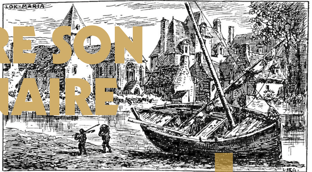
Locmaria par Louis Le Guennec