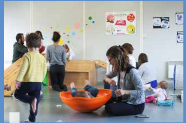
Ici, un atelier ludique au LAEP La Cabane à Briec, avec une psychomotricienne.

Quimper Bretagne Occidentale favorise l'ouverture aux autres dans ses structures. C'est pourquoi quatre lieux d'accueil enfants-parents (LAEP) sont présents dans le territoire. Ce sont des espaces conviviaux de rencontres, d'écoute et d'échange pour les futurs parents et les parents avec leurs enfants jusqu'à 4 ans, en présence de professionnelles. L'accès est anonyme et gratuit.