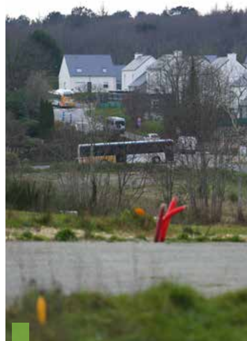
L'offre de logements se diversifie, tel ici le lotissement du Kreisker à Pluguffan. Une Maison de l'Habitat va fédérer tous les acteurs.