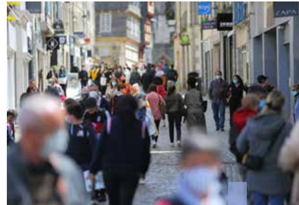
Le centre-ville de Quimper a besoin d'une nouvelle dynamique commerciale. Les halles peuvent en être le moteur si elles répondent aux attentes contemporaines.

(PEM, voie verte, bâtiment Providence...) et des logements sont rénovés. Le centre-ville accueillera de nouveaux actifs et de nouvelles familles. Ces actions visent à offrir un cadre de vie agréable et apaisé pour simplement donner envie à tous les Quimpérois et Quimpéroises, de tous les quartiers de vivre et de faire vivre notre centre-ville.