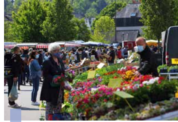
Un marché est aussi un lieu de sociabilité et de culture. S'y mêlent des enjeux autour de la qualité des produits, de l'impact environnemental et économique de la consommation.

*La commission extramunicipale était composée de commerçants, d'associations, de membres de conseils de quartier et a travaillé pendant deux mois sur le projet des halles pour enrichir la réflexion des élus.