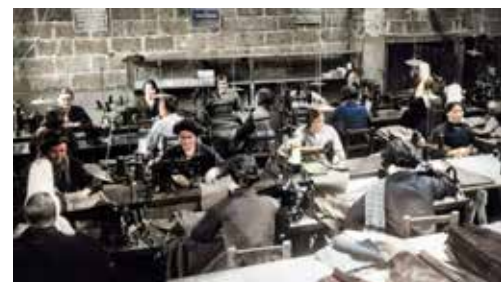
25 F11 LES OUVRIÈRES DE L'ATELIER LE GLAZIC DE QUIMPER VERS 1930

La ville de Quimper se mobilise pour la Journée internationale des droits des femmes du 8 mars. Cette journée est l'occasion de mettre l'accent sur les inégalités qui demeurent entre les hommes et les femmes, notamment dans la sphère professionnelle mais pas seulement. À Quimper, la Ville soutiendra les associations dans le cadre de plusieurs manifestations. Une exposition virtuelle réalisée par les archives municipales mettra notamment en lumière le mouvement d'émancipation des femmes quimpéroises à travers une sélection de 25 photographies. Retrouvez tout le programme des manifestations sur le site de la Ville.