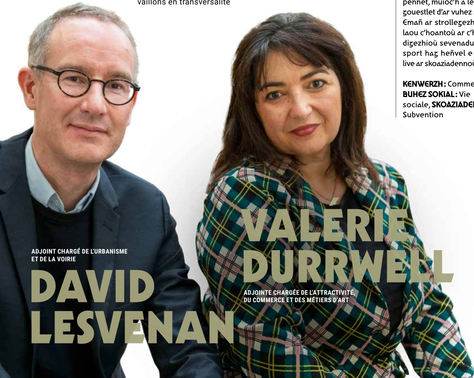
ADJOINT CHARGÉ DE L'URBANISME ET DE LA VOIRIE

KENWERZH : Commerce, BUHEZ SOKIAL : Vie sociale, SKOAZIADENN : Subvention