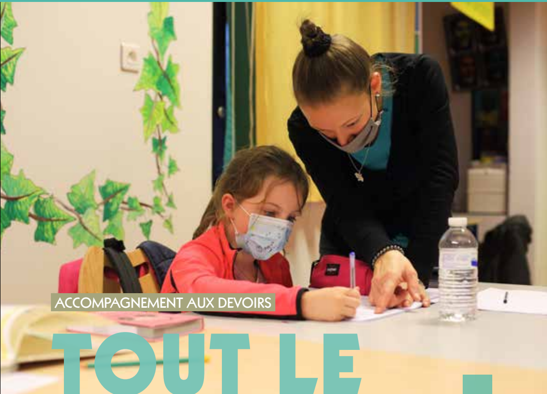
ACCOMPAGNEMENT AUX DEVOIRS