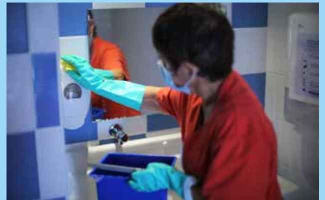
Photo de couverture : Malgré un contexte compliqué, la rentrée 2020 s'est déroulée dans de bonnes conditions.

Le nettoyage : il concerne au minimum une fois par jour les sols, tables, bureaux, poignées de porte. Tables et chaises du restaurant sont désinfectées entre les deux services et même si la limitation du brassage n'est plus obligatoire, les enfants déjeunent par classe.