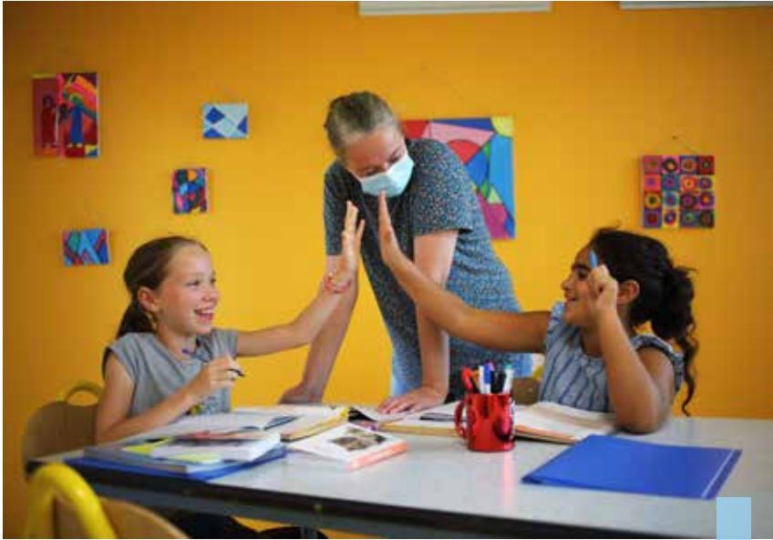
Un temps d'aide aux devoirs est proposé dans toutes les écoles publiques.