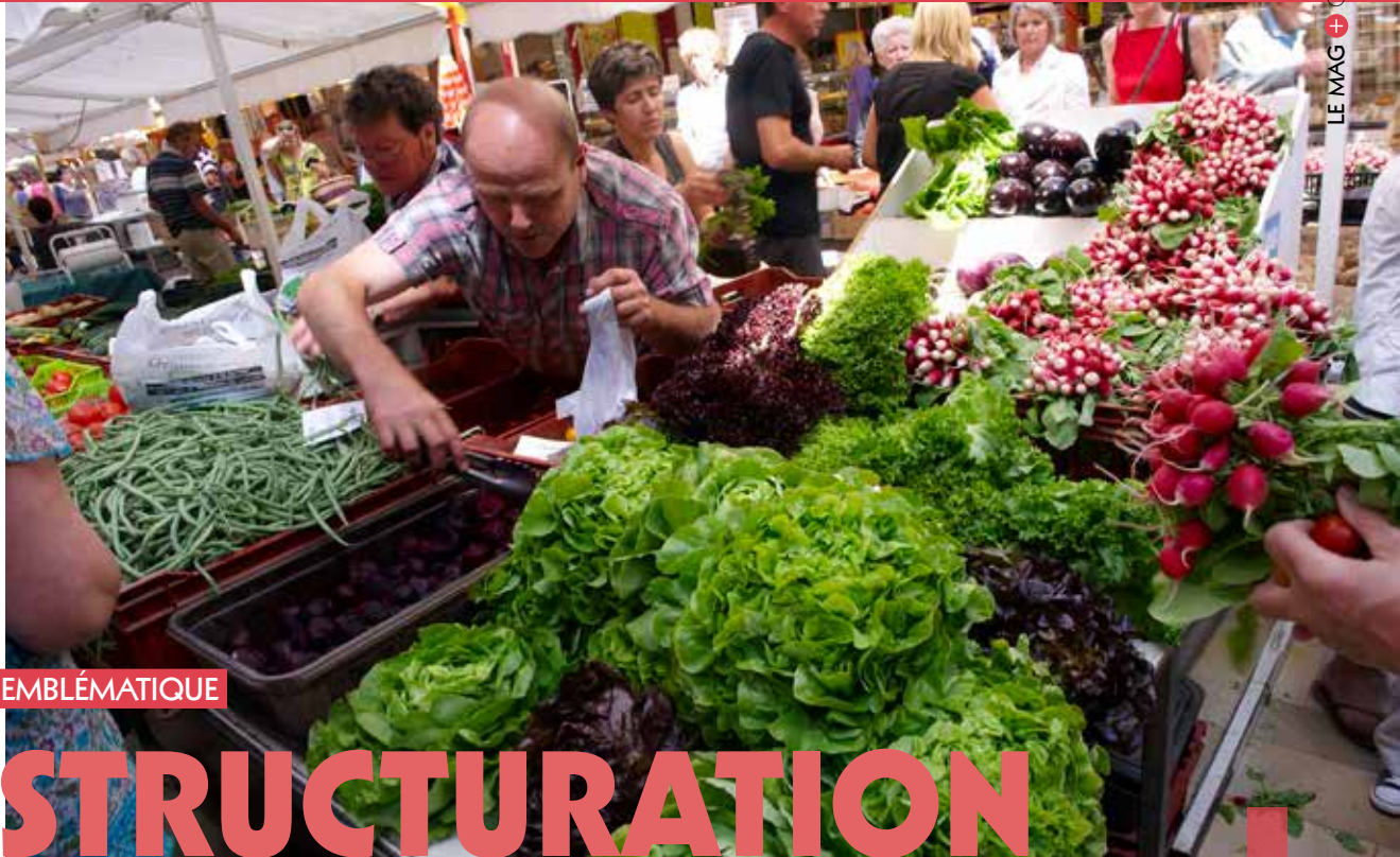
Photo ci-contre : Bâtiment bien connu des Quimpérois, les halles doivent nécessairement subir une refonte d'envergure.

Photo de couverture : Restructuration ou halles neuves ? Les Quimpérois sont invités à donner leur avis le dimanche 3 mars.